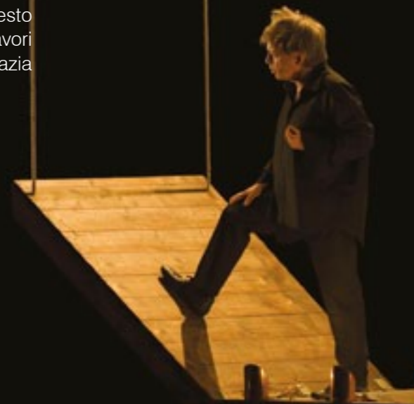
Nella foto: Il mistero buffo - nella versione pop 2.0 (mercoledì 28 e giovedì 29 dicembre 2011)