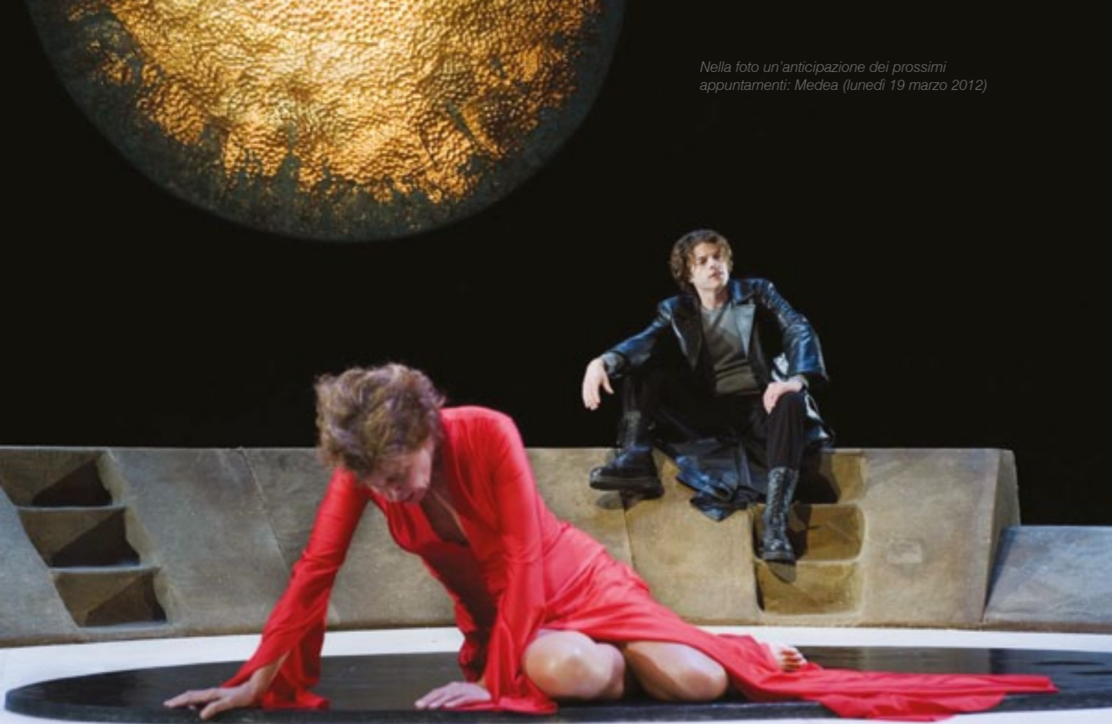
Nella foto un'anticipazione dei prossimi appuntamenti: Medea (lunedì 19 marzo 2012)