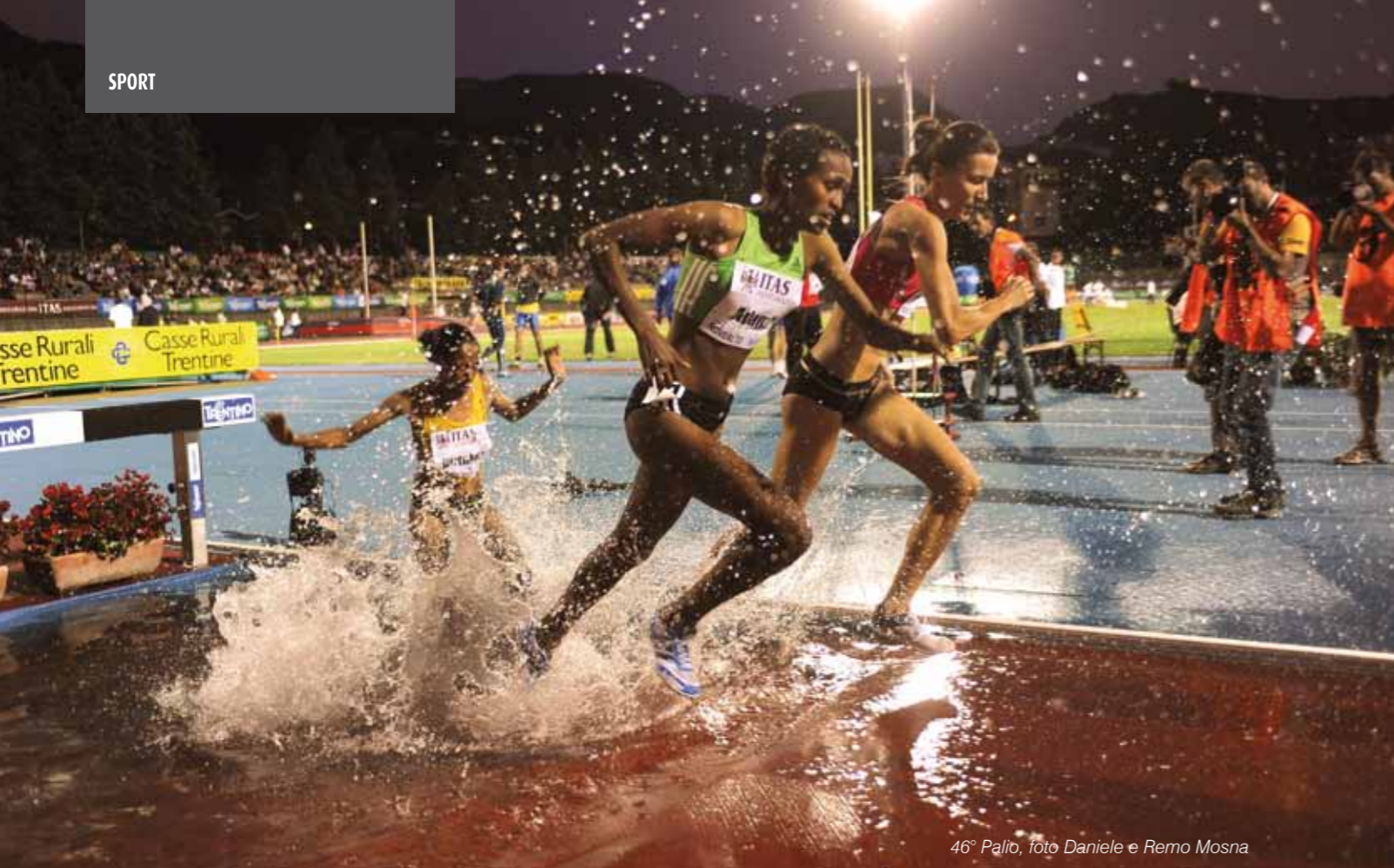
46° Palio