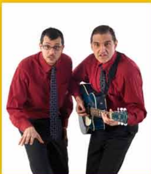
ROVERETO ESTATE CABARET

L'Assessore Filippi conclude: "Il merito di tutto questo va senz'altro al Servizio Cultura del Comune di Rovereto, che ha dato l'ennesima dimostrazione di professionalità, cura e capacità organizzativa. Ma il merito va anche alle tante realtà - associazioni, gruppi, compagnie e artisti - che animano questo programma e che fanno di Rovereto Estate, anche per il 2011, un'occasione di attrazione eccezionale, non solo nell'ambito provinciale. Buona estate a tutti!"