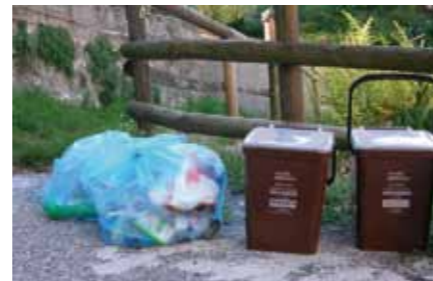
Sacchi azzurri porta a porta (imb. leggeri)

stati raccolti a parte in un apposito sacco semi-trasparente di colore azzurro.