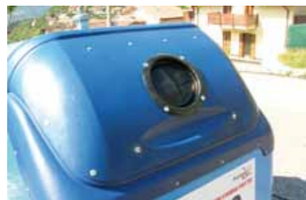
Campane azzurre con oblò (vetro)

azzurre venivano introdotti rifiuti non idonei, dovuti non solo ad errata interpretazione del concetto, per non parlare di rifiuti ingombranti. Questo comportamento scorretto, oltre a determinare maggiori costi per la selezione del materiale all'impianto di conferimento, implica notevoli costi anche per lo smaltimento delle impurità alle discariche autorizzate. In alcune analisi si è arrivati persino al 48% di impurità, con valori medi pari al 30-35%.