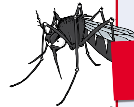
illustrazione zanzara tigre di Giacomo Vianello

Come ogni anno, il Comune si fa promotore dei provvedimenti per la prevenzione e il controllo dell'infestazione della "aedes albopictus", comunemente detta zanzara tigre, attraverso l'ordinanza n°59/2011 del 28 aprile, valida dal 15 maggio al 31 ottobre 2011.