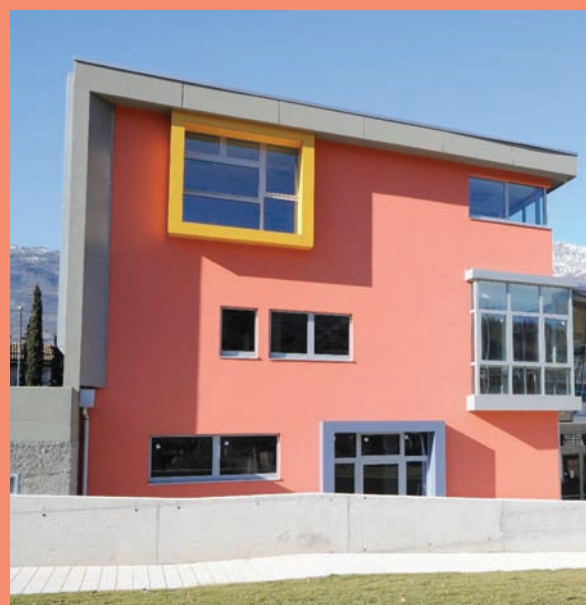
Il nuovo Centro Giovani

Finisterrae di Novara, hanno preso parte 30 diversi soggetti tra i quali, mese dopo mese, si sono formate importanti collaborazioni. L'associazione accreditata AltreVie ha avuto proprio in questo uno dei suoi punti di forza, riuscendo a unire in un progetto condiviso circa la metà dei soggetti che hanno partecipato a questo percorso, rappresentando quindi un esempio di co-progettazione basato sul fare rete sul territorio.