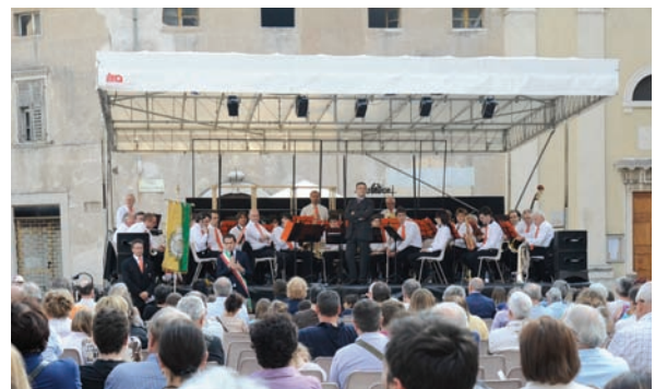
Alcuni momenti della Notte Verde 2012

La Notte Verde nasce dalla collaborazione tra Assessorato alla contemporaneità e Assessorato all'ambiente del Comune di Rovereto e vanta un vastissimo parterre di collaborazioni su tutto il territorio cittadino e provinciale, a partire dal Festival dell'Economia che porterà a Rovereto tre eventi di altissima caratura, poi Comunità della Vallagarina, MART, Museo Civico, Biblioteca, Manifattura Domani, Associazioni di categoria (commercianti, artigiani, agricoltori), Trentino Sviluppo, Strada del vino/Slow Food, Associazioni sportive e culturali, CeRiSM, Azienda Sanitaria, Fare Green, The Hub e molti altri ancora. Preludio all'iniziativa sarà la diretta dal Festival dell'Economia presso l'Urban Center: tutti gli eventi saranno visibili in streaming dal 30 maggio al 1 giugno.