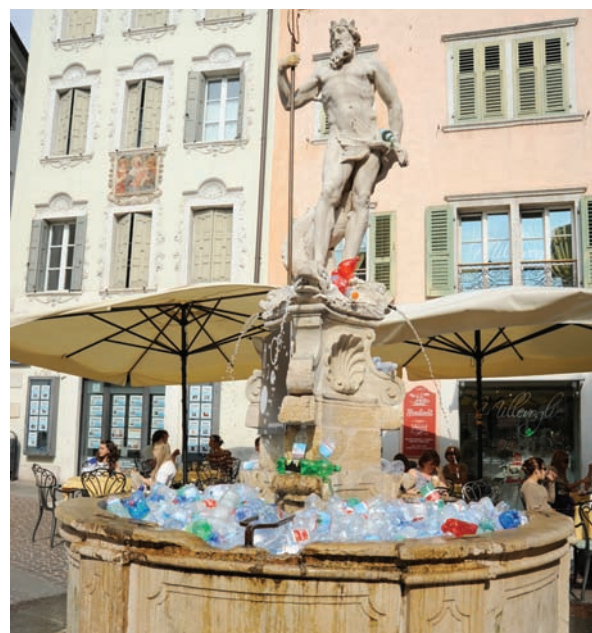
Installazione Notte Verde 2012

Concerto della Banda Cittadina di Rovereto.